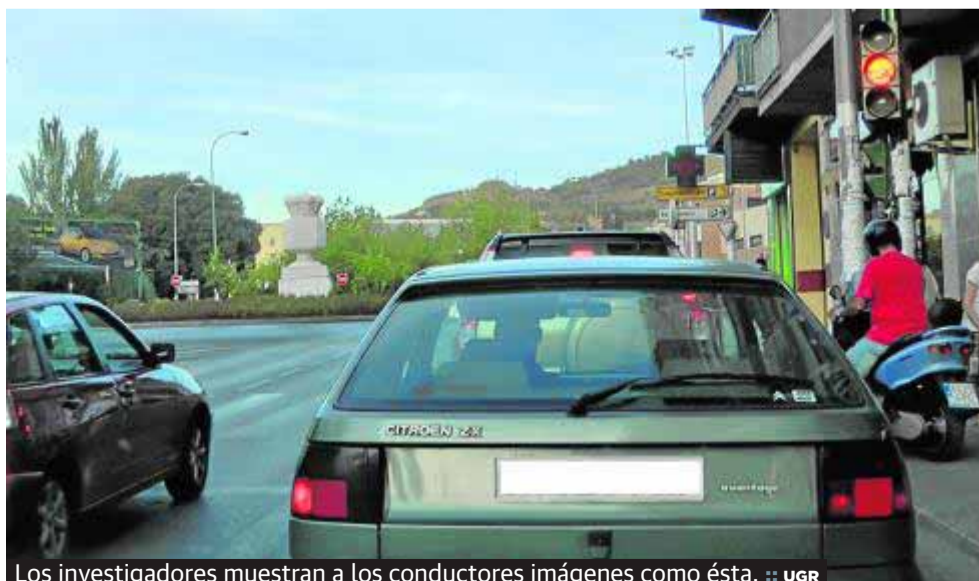
Los investigadores muestran a los conductores imágenes como ésta.

La investigación, desarrollada por científicos del Centro de Investigación Mente, Cerebro y Comportamiento