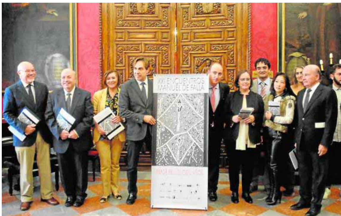
Presentación de los XXI Encuentros Manuel de Falla, ayer, en el Ayuntamiento.