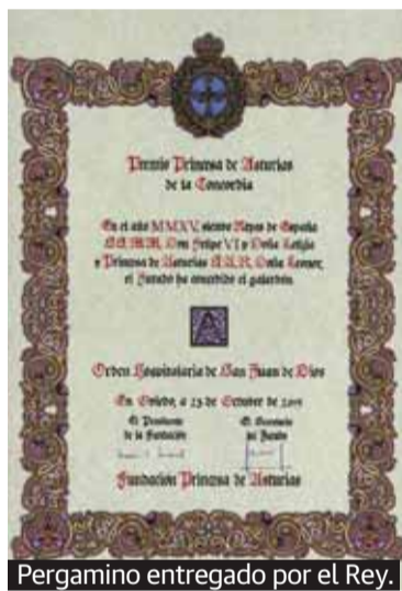
Pergamino entregado por el Rey.