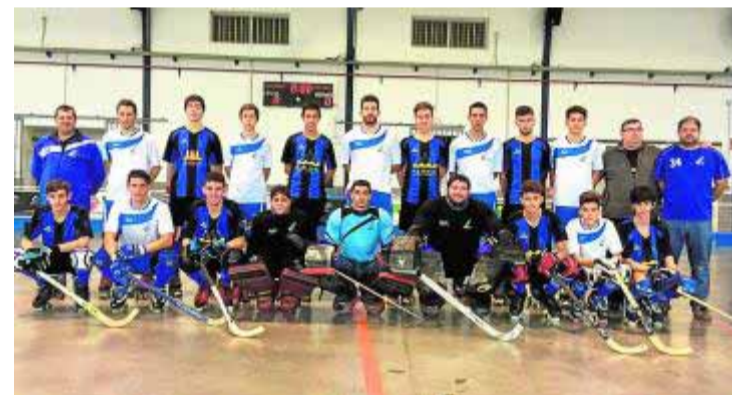
Plantillas del Alhambra y Cájar de Primera Andaluza.

La próxima cita para los equipos del Patín Cájar será el fin de semana del 7 y 8 de noviembre, en el que debutará su plantel de Nacional Sur con un doble encuentro en tierras levantinas tanto del Cájar -Cocentaina y Muro- como del Alhambra (Raspeig y Alcoy).