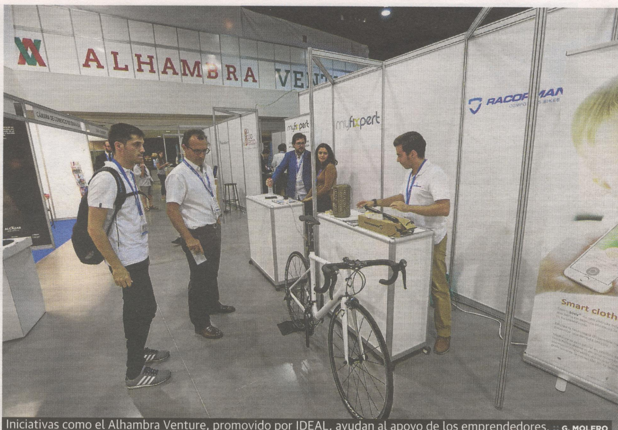
Iniciativas como el Alhambra Venture, promovido por IDEAL, ayudan al apoyo de los emprendedores.

En principio, la DGT tiene previsto dar a conocer los vídeos a modo divulgativo, «porque es positivo que la gente los conozca y vea su utilidad», señala la investigadora.