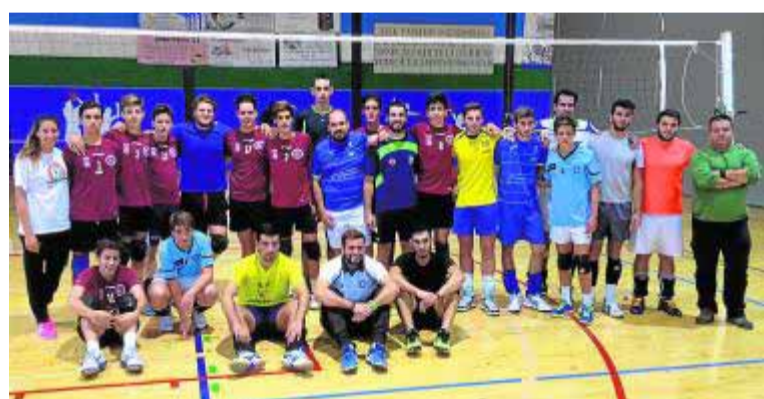
Algunos de los integrantes del filial universitario en Gójar.