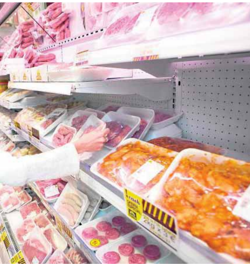
un paquete de salchichas frescas en el Cash Zurita.