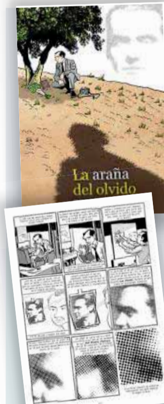
Portada y una de las páginas de la novela gráfica.