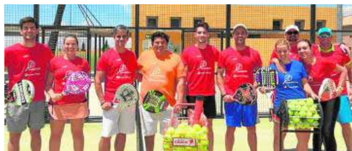
Alumnos de la pasada edición del curso de pádel. :: IDEAL

El curso, para el que ya es posible apuntarse en la Fundación General de la UGR, arrancará el próximo 9 de noviembre y concluirá el 5 de febrero, un periodo en el que trabajarán tres grupos con un máximo de veintinueve alumnos cada uno. El coste es de 300 euros y tendrá una validez de diez créditos ECTS, si bien cada facultad puede reducir esa cantidad.