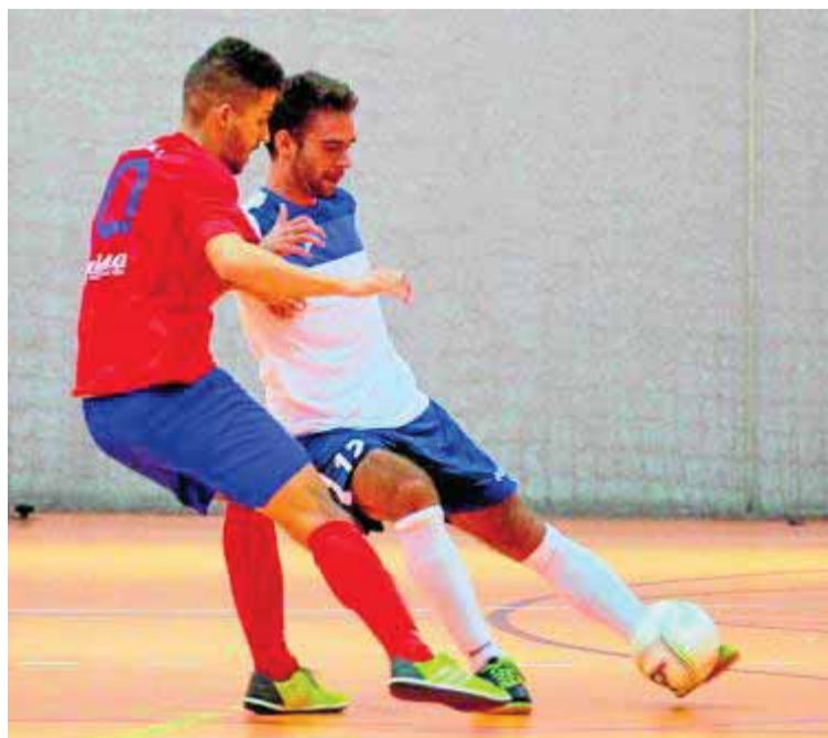
El Peligros sufrió una nueva derrota lejos de su pista.

Los resultados de los encuentros de esta mañana –cuando saltarán a la pista Melilla, Victoria Kent y Villa del Río– determinarán la profundidad del ‘charco’ en el que se ha metido la escuadra granadina, a la que su irregularidad lejos de su cancha les está lastrando en este estreno liguero en Segunda B.