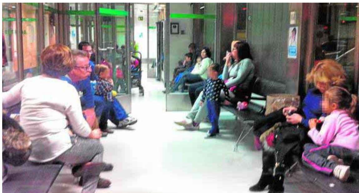
Urgencias del Materno-Infantil, muy llenas estos días por los virus respiratorios.

Tras su inicial trabajo en diferentes laboratorios, ha logrado trasladar su análisis a pacientes, lo que se denomina investigación «traslacional» para alcanzar así una medicina más personalizada.