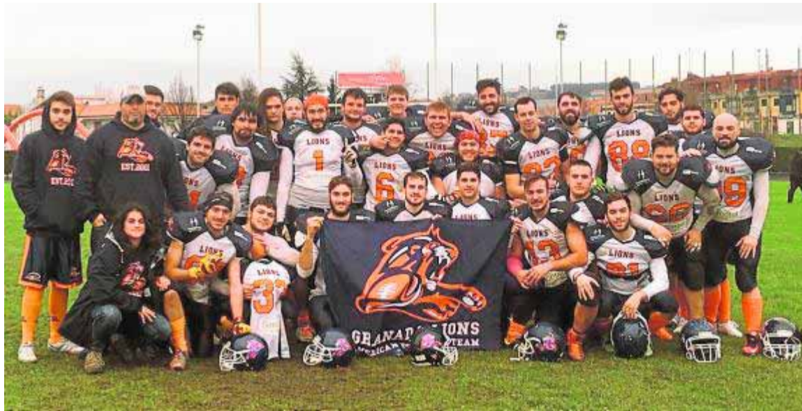
Plantilla al completo de los Lions que se desplazó a Gijón para el estreno en la Serie B.

El cuadro nazarí no arrancó el partido en buena sintonía, lo que se tradujo en varios errores que costaron el primer 'touchdown'. Esa jugada recibiría el castigo añadido de que Mariners logró la conversión de dos puntos tras una jugada de engaño, lo que puso el 8-0 en un marcador que ya no se movería más hasta la segunda parte. Las defensas de ambos clubes trabajaron a destajo para evitar que los 'drives' llegaran hasta la zona de anotación, por lo que los locales se marcharon al descan-