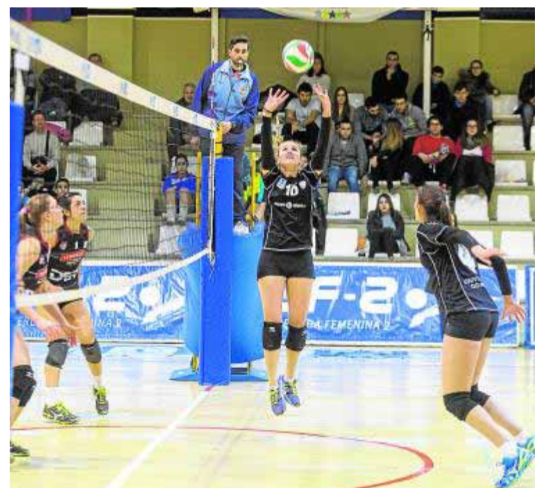
La colocadora prepara el remate del Universidad.

Las tornas cambiaron en el segundo set, puesto que las jugadoras de Fran Santos tomaron el mando y no lo soltaron hasta que impusieron su ley. Las granadinas gozaron de rentas cortas pero suficientes para evitar que el Guadalajara pusiera en peligro el resultado. Cinco puntos seguidos de las visitantes resultaron cruciales para establecer un escl-