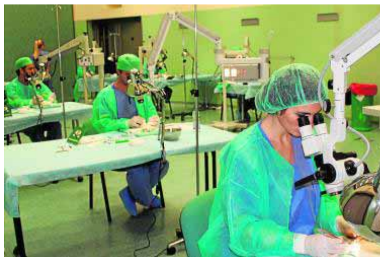
Curso de formación de los MIR en el CMAT. ::

Las acciones se desarrollan en la zona quirúrgica del Complejo Multifuncional Avanzado de Simulación e Innovación Tecnológica (CMAT)-línea Iavante de la Fundación Progreso y Salud, ubicado en el Parque Tecnológico de la Salud (PTS), donde se cuenta con quirófanos dotados con el mismo equipamiento que los escenarios reales, posibilitando que los profesionales entrenen es-