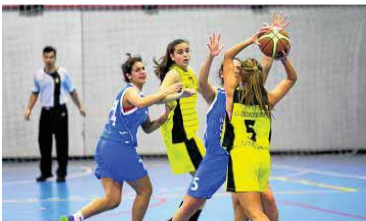
La Presentación y los Agustinos miden sus fuerzas. :: GONZÁLEZ MOLERO

Con respecto al apartado masculino de Primera Nacional, el Meridiano Baza sumó su décima victoria y