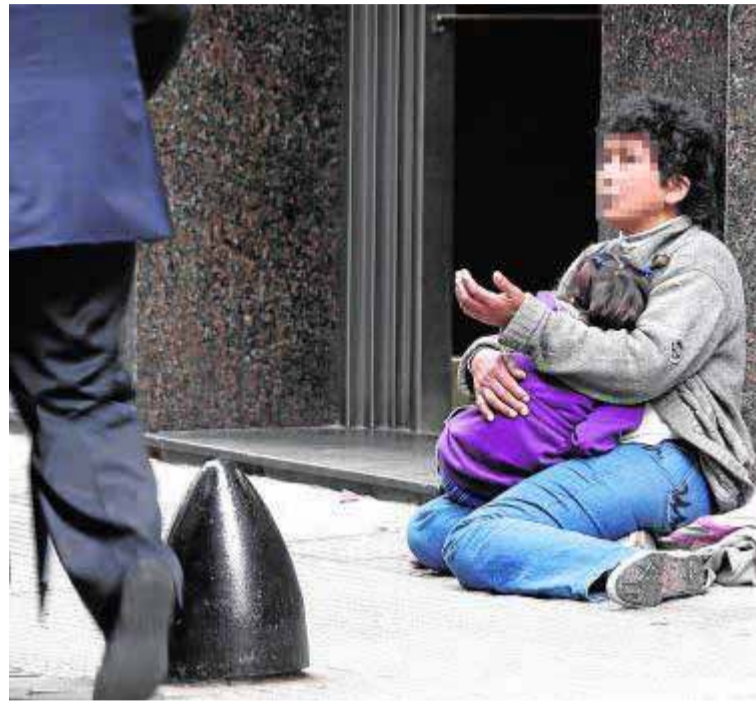
Una mujer pide limosna en la calle con su hijo en brazos.

La 'madre-niña' fue sorprendida por primera vez por patrulleros de la guardia municipal cuando mendigaba con su bebé la tarde del 29 de abril del pasado año 2015. Sucedió en pleno centro de la capital granadina. La joven se había colocado en la confluencia de dos calles por las que transitan a diario cientos de ciudadanos. En ese punto, según el relato de los hechos elaborado por la Fiscalía de Menores de Granada, «pedía limosna a los transeúntes mien-