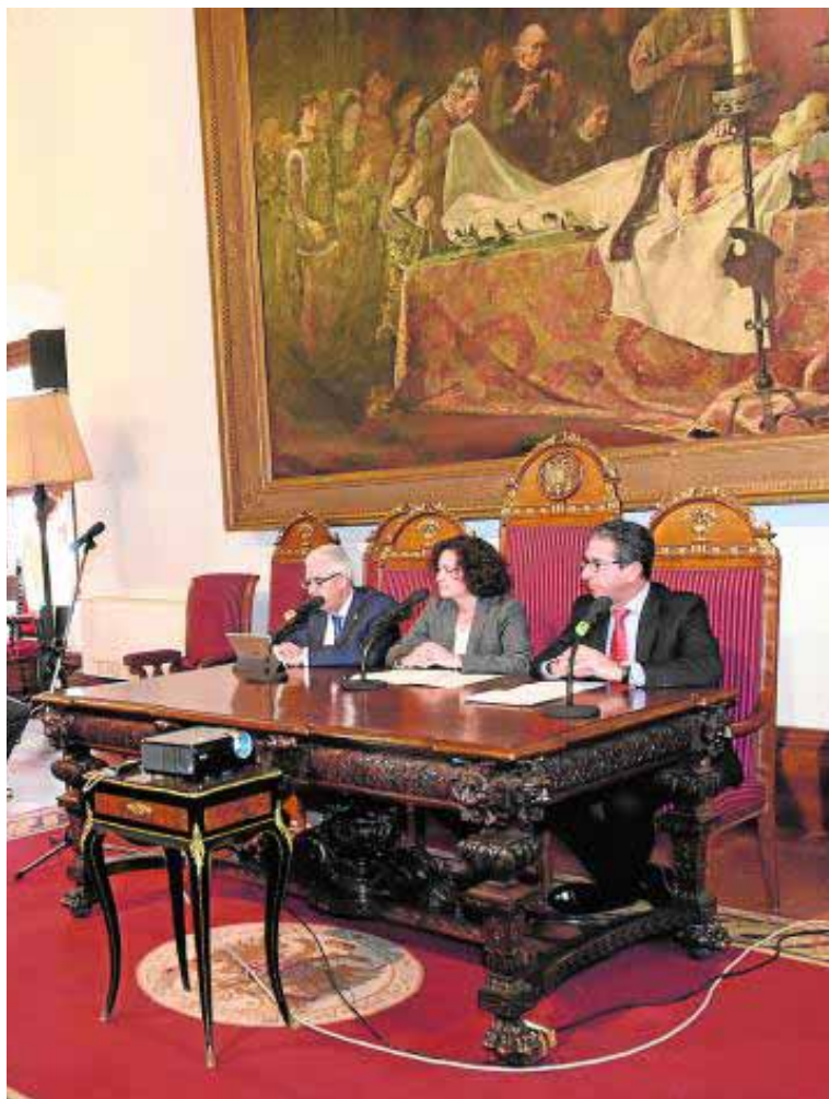
Acto de convocatoria de las becas, ayer en el Hospital Real.