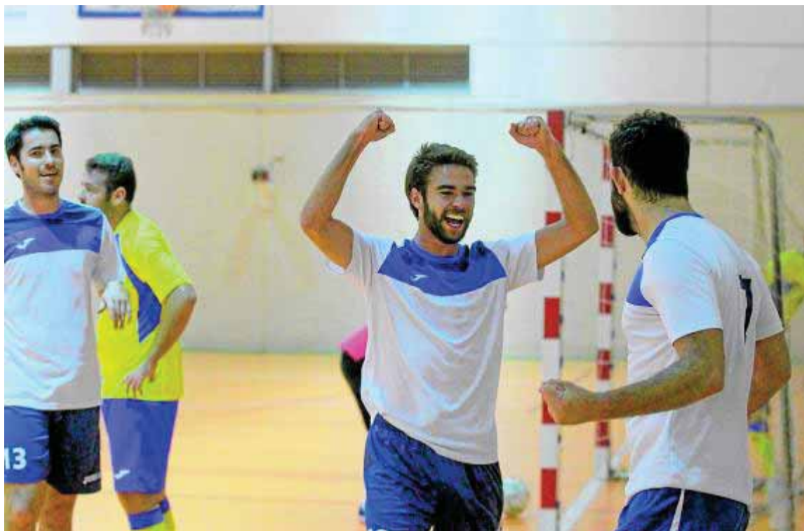
Los jugadores del Peligros FS celebran un gol en su pista.

Para ello resulta indispensable que los granadinos saquen adelante el partido de esta tarde ante Bujalance, un rival «con bagaje en la categoría y experiencia suficiente para darnos más de un quebradero de cabeza. Si nos creemos superiores porque solo tengan ocho puntos caeremos en un grave error», alerta el técnico granadino. Balboa también afirma que su bloque «imprimirá su intensidad habitual para lograr la tercera plaza. Lo primero es ser solidario atrás, pues arriba tenemos calidad para hacer goles». Ese talento ha