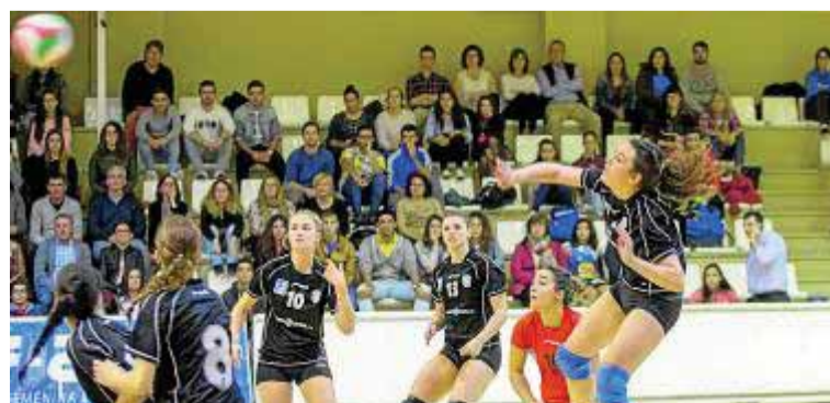
Imagen de un partido anterior del Universidad.