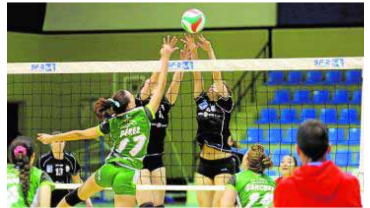
Bloqueo del Universidad en Fuentenueva.

Los otros clubes de la provincia presentes en este autonómico de velocidad son el Universidad de Granada -con una decena de nadadores-, Granada-Ogijares, Náutico de Motril y Las Gabias, que aportan nueve cada uno.