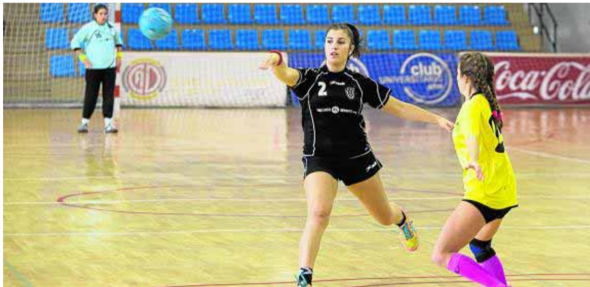
Pase para distribuir el juego en una circulación del Universidad en Fuentenueva.

Después de ocho derrotas consecutivas, las jugadoras capitalinas necesitan cualquier tipo de estímulo para no terminar de hundirse por completo en la clasificación de División de Honor Plata. Hasta el momento, al 'Uni' le salva la mala racha del Fuengirola -con el que comparte el puesto de colista- y Sure-Granca, que solo aventaja a las granadinas en dos puntos.