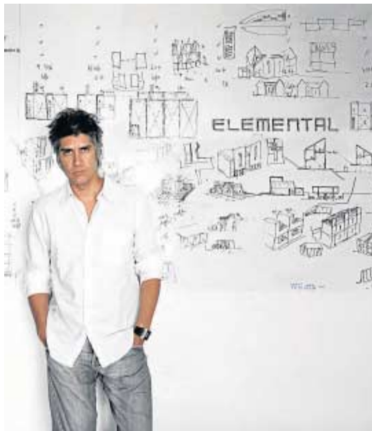
El arquitecto Alejandro Aravena.

Pero más allá de su país natal, Aravena (Santiago de Chile, 1967) ha realizado otros proyectos destacados en Estados Unidos, México, China y Suiza, tan-