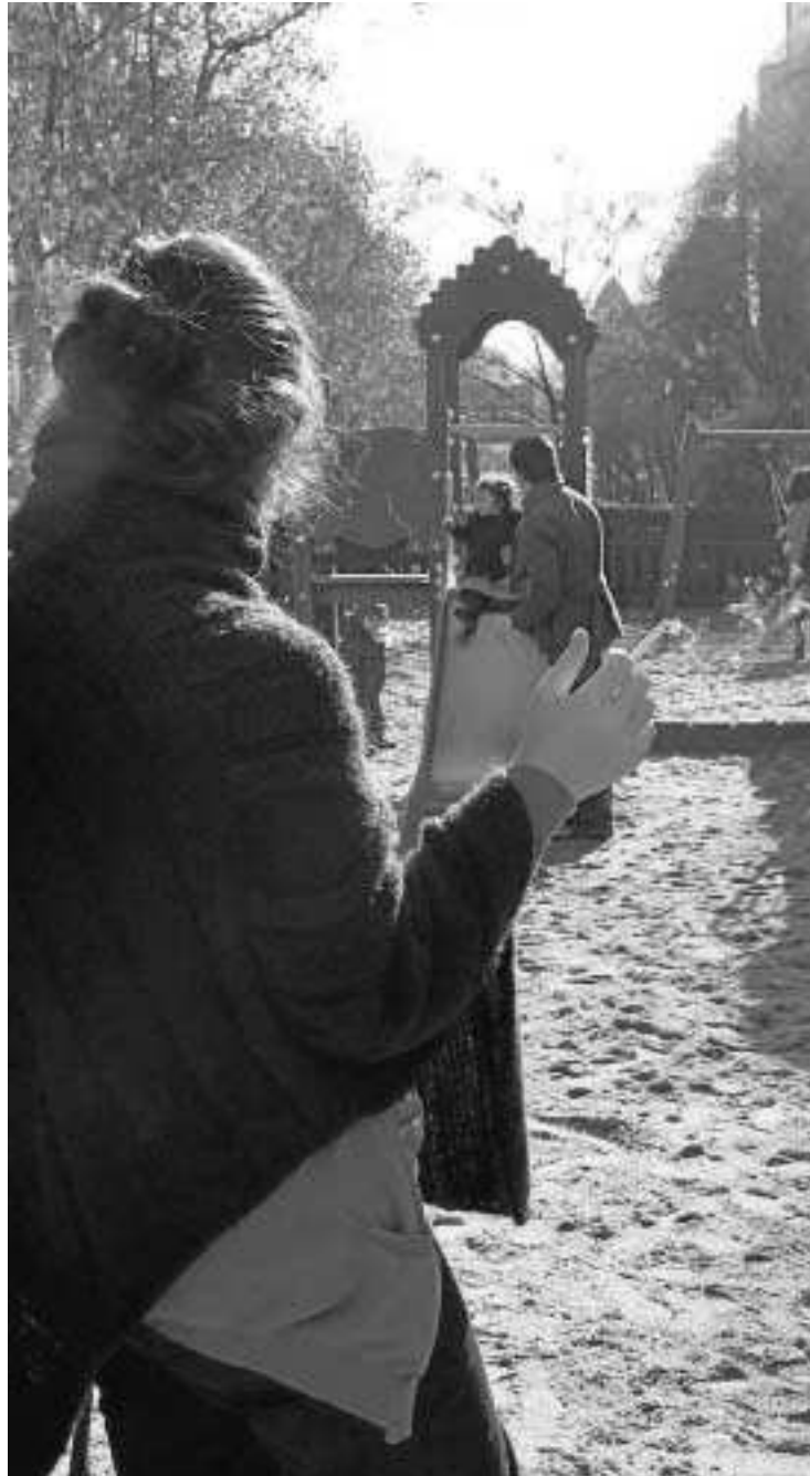
La mitad de los niños estudiados son fumadores pasivos.