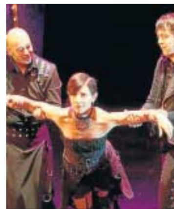
Un momento de 'La barraca del zurdo'.

Este espectáculo es un homenaje a ese viaje sin fin, a esos artistas de variedades que supieron mantener el compromiso con la sociedad desde su arte a lo largo de más de 90 años, a esas familias que supieron permane-