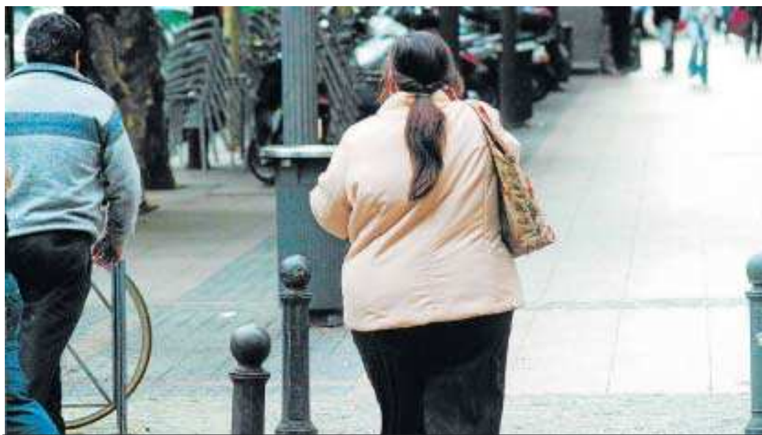
Los resultados han sido publicados en el último número de la prestigiosa revista 'Cancer Research'.

El cáncer de mama afecta más y es más agresivo con las personas obesas porque la grasa peritumoral, la que rodea el tumor, facilita la expansión e invasión de las células madre cancerígenas, responsables del inicio y crecimiento del cáncer. Así lo establece una investigación llevada a cabo por un equipo internacional de científicos en el que participa la Universidad de Granada, que informaron ayer de este avance. Las células madre cancerígenas se encuentran en los tumores en muy bajo número y tienen como característica importante la formación de las metástasis en sitios diferentes al tumor original.