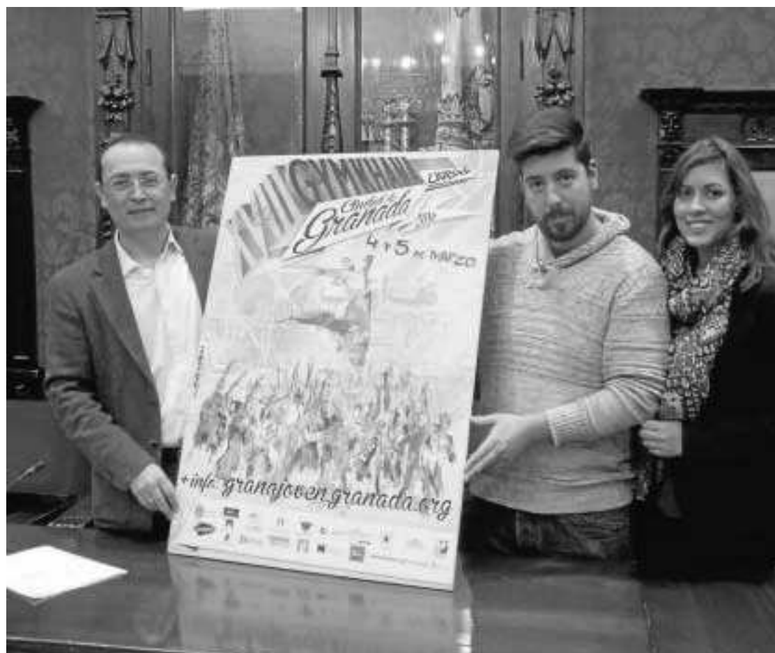
La actividad se presentó ayer en el ayuntamiento.