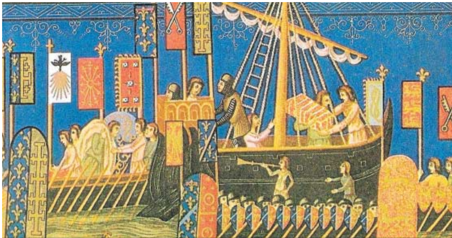
Miniatura de los Estatutos de la Orden del Espíritu Santo expuesta en el Museo del Louvre, París.