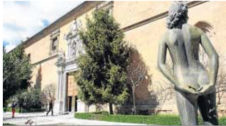
Imagen del Hospital Real, sede del Rectorado.

versidades es objeto de atención prioritaria”. “Desde mi llegada al Gobierno ya se han incorporado a la tesorería de las Universidades 140 millones y antes de final de mes llegarán otros 100 millones, de forma que en total son 240 millones”, comentó el consejero durante su visita a las instalaciones de los Laboratorios Rovi. El consejero explicó que la prioridad de la Consejería es el pago a proveedores. “En la línea de ir eliminando las dificultades que había, hemos cambiado el modelo para concentrar la distribución de la tesorería. Lo importante no es