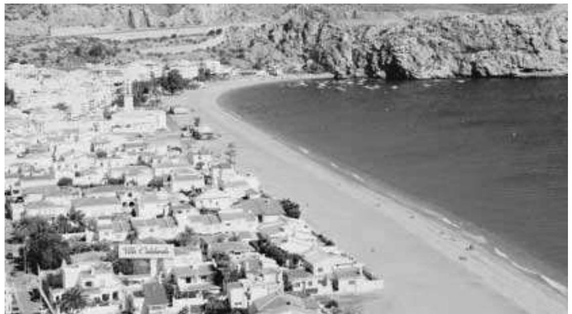
Calahonda es uno de los municipios con cuentas saneadas.

De ahí que pida a Madrid que "no frene a las administraciones que tienen sus cuentas saneadas". Y es que en plena crisis se confeccionaron unos presupuestos muy austeros y en los siguientes años no pueden incrementar más de